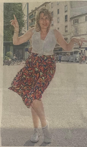
« J'ai fait une maîtrise sur la montée du fascisme dans les années 30... »

Dans le spectacle, je mentirais si je disais qu'on n'avait pas des blagues parfois faciles, mais j'aime bien que le rire soit aussi une réflexion sur la vie, aborder les problèmes sociaux, politiques. On a notamment une chanson sur tous les présidents de la République, "5 minutes douche comprise". On a aussi